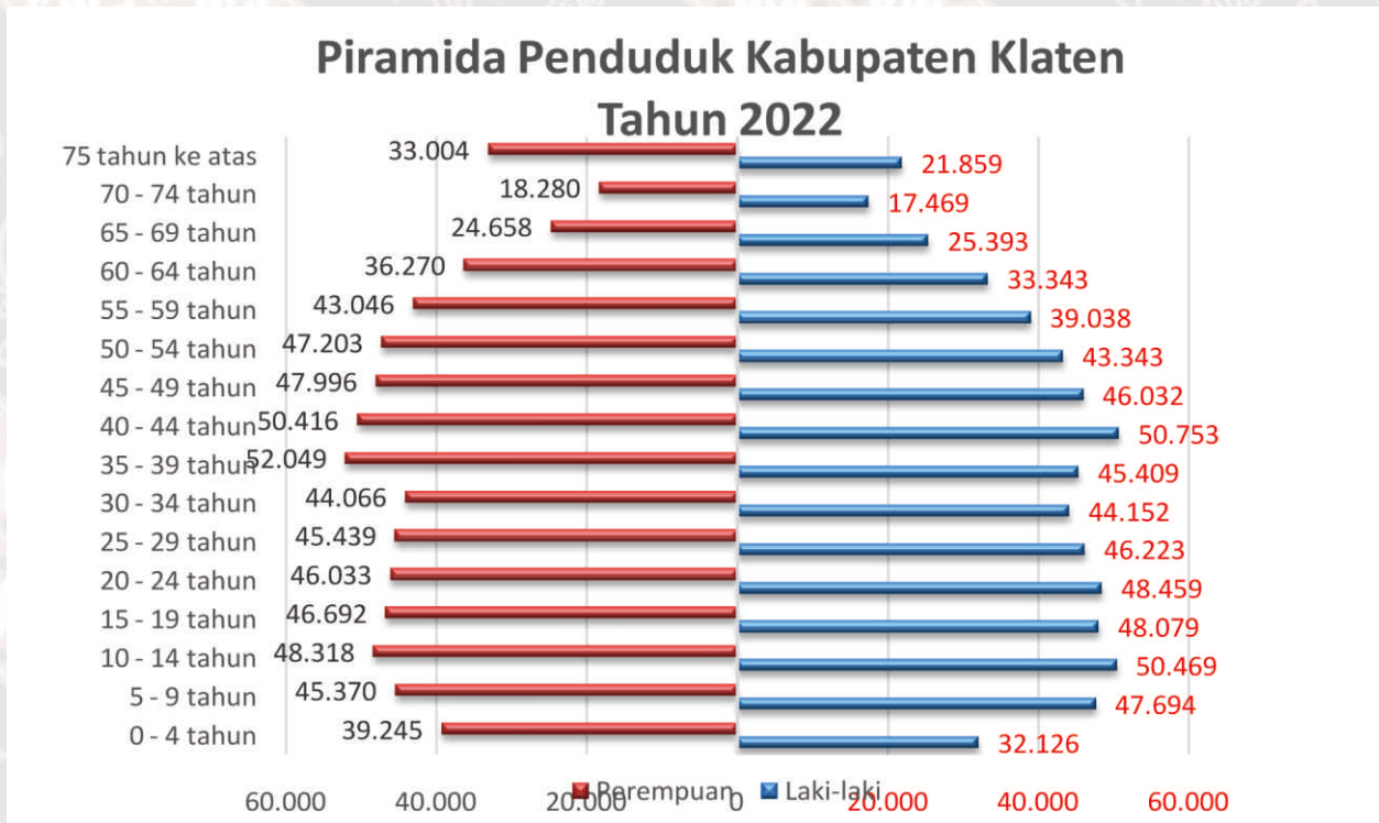
Gambar IV.1. Piramida Penduduk Kabupaten Klaten

Pada piramida penduduk Kabupaten Klaten tahun 2022, komposisi penduduk tertinggi berada pada rentang umur 10-14 tahun dimana komposisi penduduk laki-laki sebesar 3,92% dan penduduk perempuan 3,72% dengan total jumlah penduduk laki-laki dan perempuan pada rentang umur tersebut sebanyak 98.321 jiwa. Adapun komposisi penduduk terkecil berada pada rentang umur 70-74 tahun dengan persentase penduduk laki-laki sebesar 1,36% dan penduduk perempuan 1,52%.