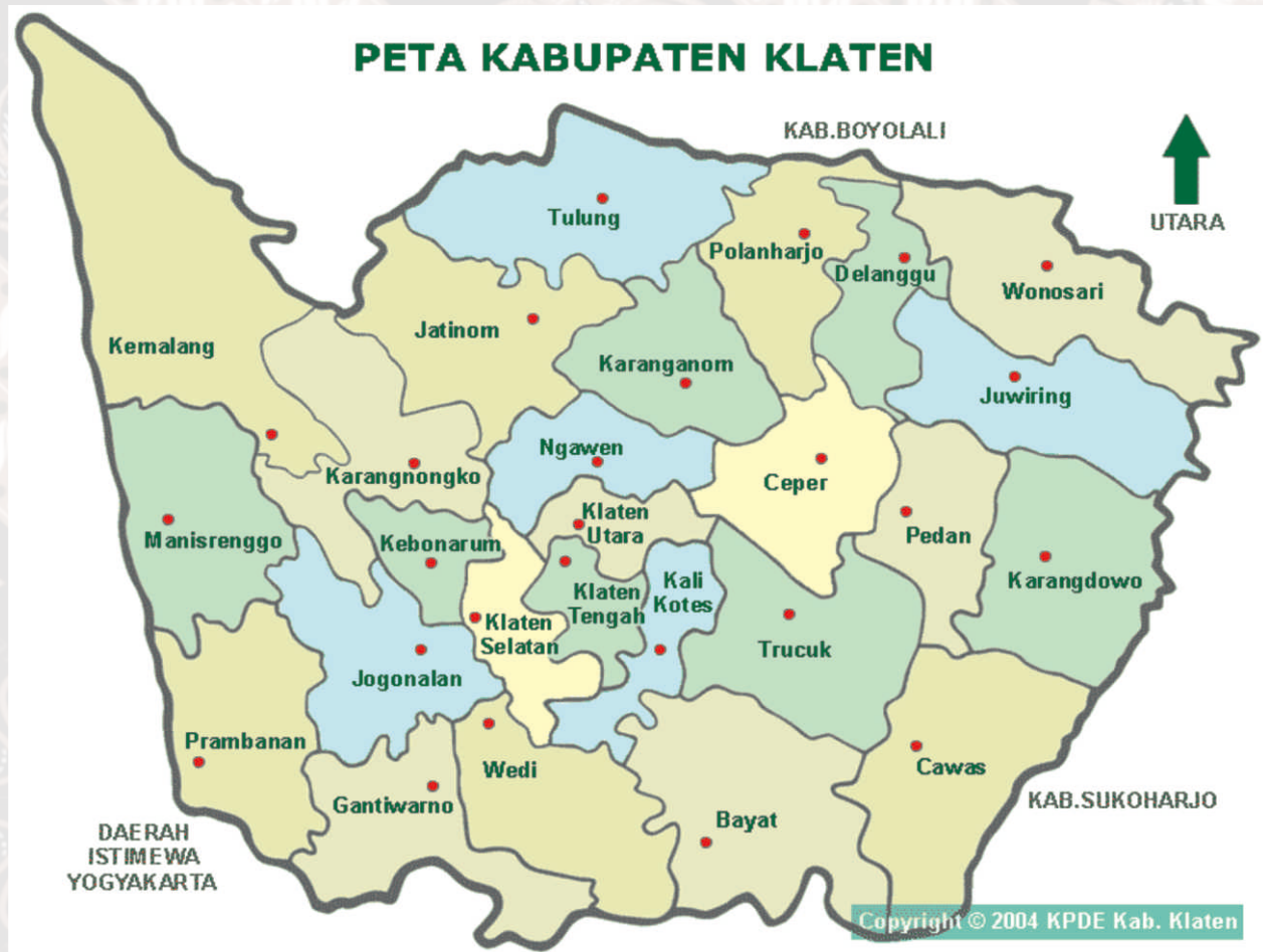
Gambar II.1 Peta Kabupaten Klaten

Sejarah Klaten tersebar di berbagai catatan arsip-arsip kuno dan kolonial, arsip-arsip kuno dan manuskrip Jawa. Catatan itu seperti tertulis dalam Serat Perjanjian Dalem Nata, Serat Ebuk Anyar, Serat Siti Dusun, Sekar Nawala Pradata, Serat Angger Gunung, Serat Angger Sedasa dan Serat Angger Gladag. Dalam bundel arsip Karesidenan Surakarta menjadikan rujukan sejarah Klaten seperti tercantum dalam Soerakarta Brieven van Buiten Posten, Brieven van den Soesoehoenan 1784-1810, Dagregister van den Resi dentie Soerakarta 1819, Reporten 1787-1816, Rijksblad Soerakarta dan Staatblad van Nederlandsche Indie. Babad Giyanti, Babad Bedhahipun Karaton Negari Ing Ngayogyakarta, Babad Tanah Jawi dan Babad Sindula menjadi sumber lain untuk menelusuri sejarah Klaten.