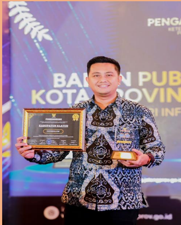
Gambar 11. Penghargaan KIP Awards 2025 diterima oleh Bupati Klaten