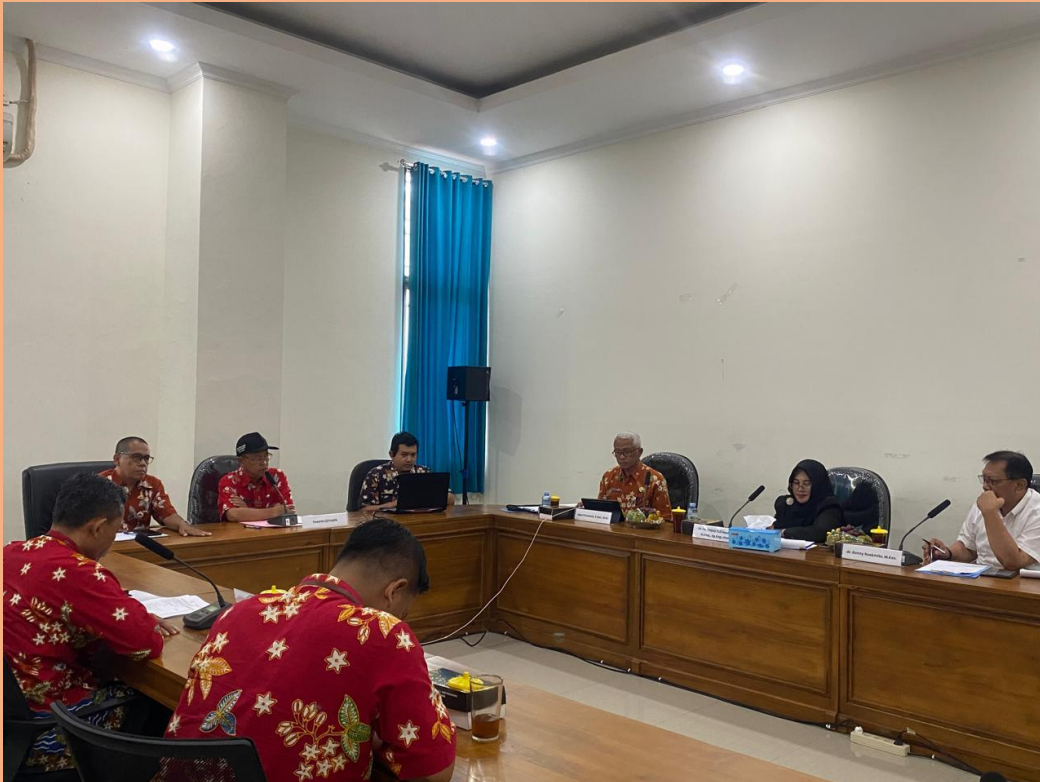
Gambar 7. Uji Publik Pemeringkatan KIP Tahun 2025 Badan Publik Badan/Dinas