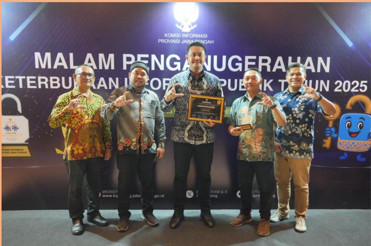
Gambar 12. Kepala Diskominfo Kabupaten Klaten mendampingi Bupati Klaten dalam KIP Awards 2025