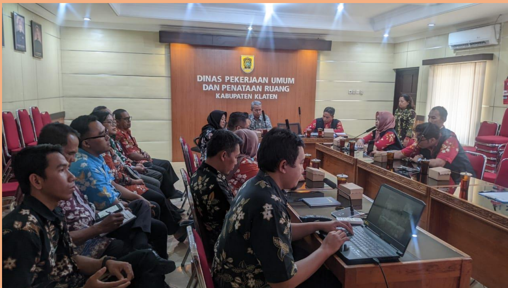
Gambar 6. Visitasi Pemeringkatan KIP Tahun 2025 di Badan Publik Badan/Dinas