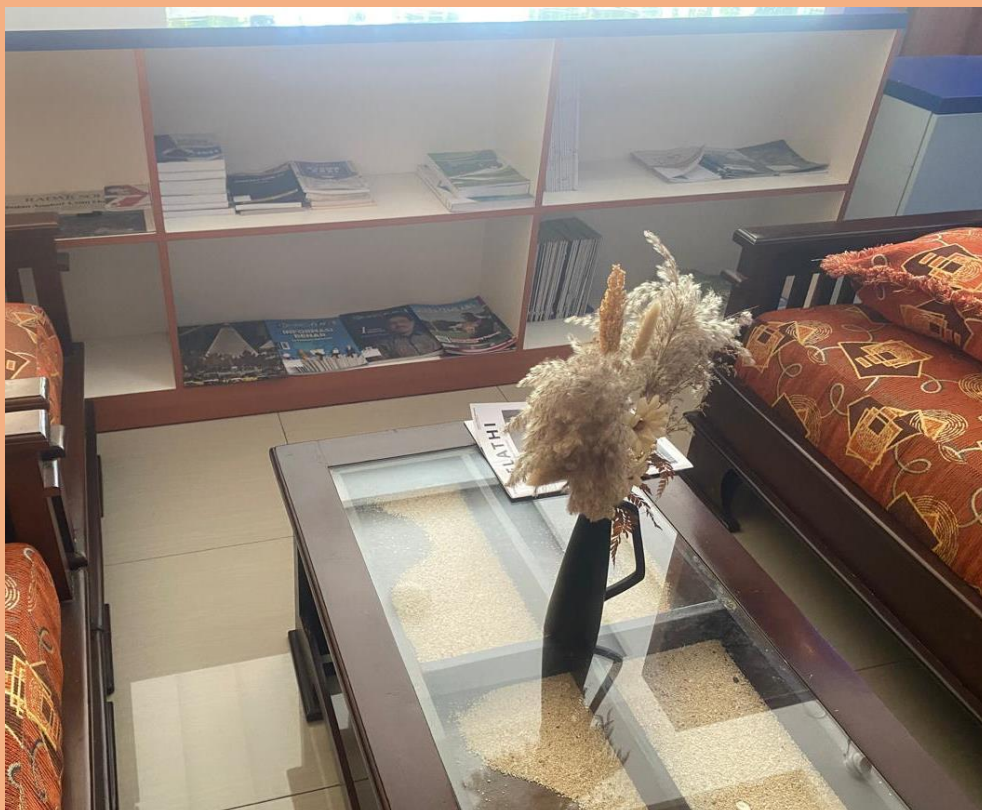
3. Ruang tunggu