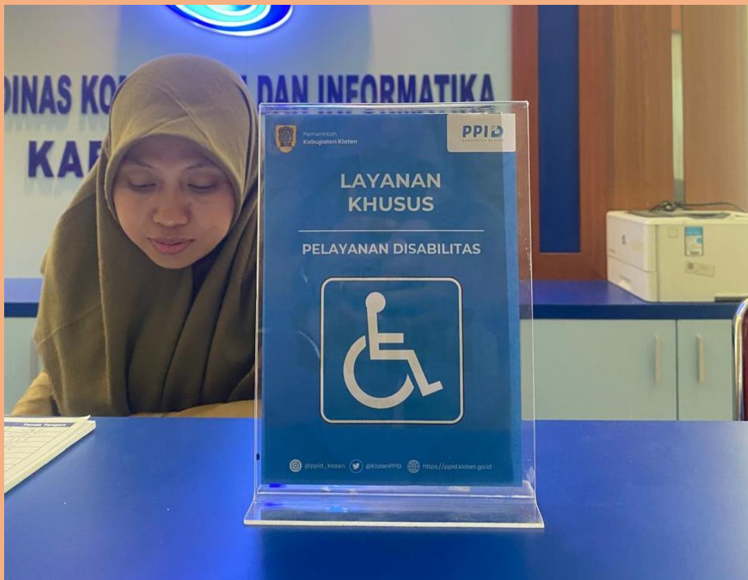
Gambar 1. Loket Khusus Pelayanan bagi Penyandang Disabilitas