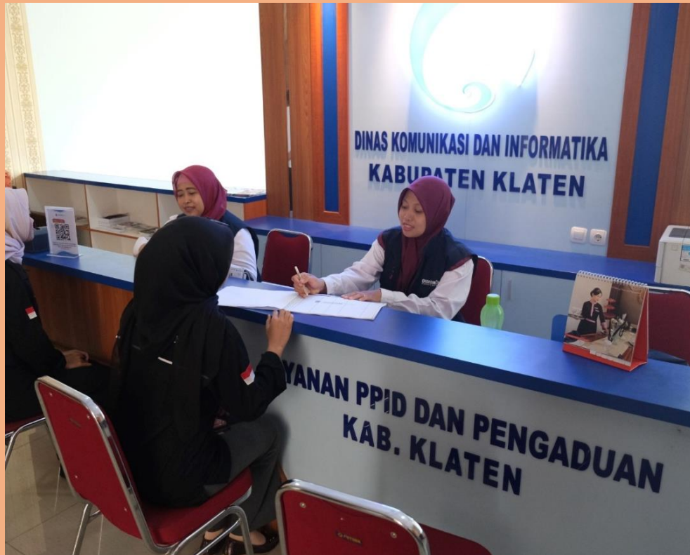
2. Pojok Baca