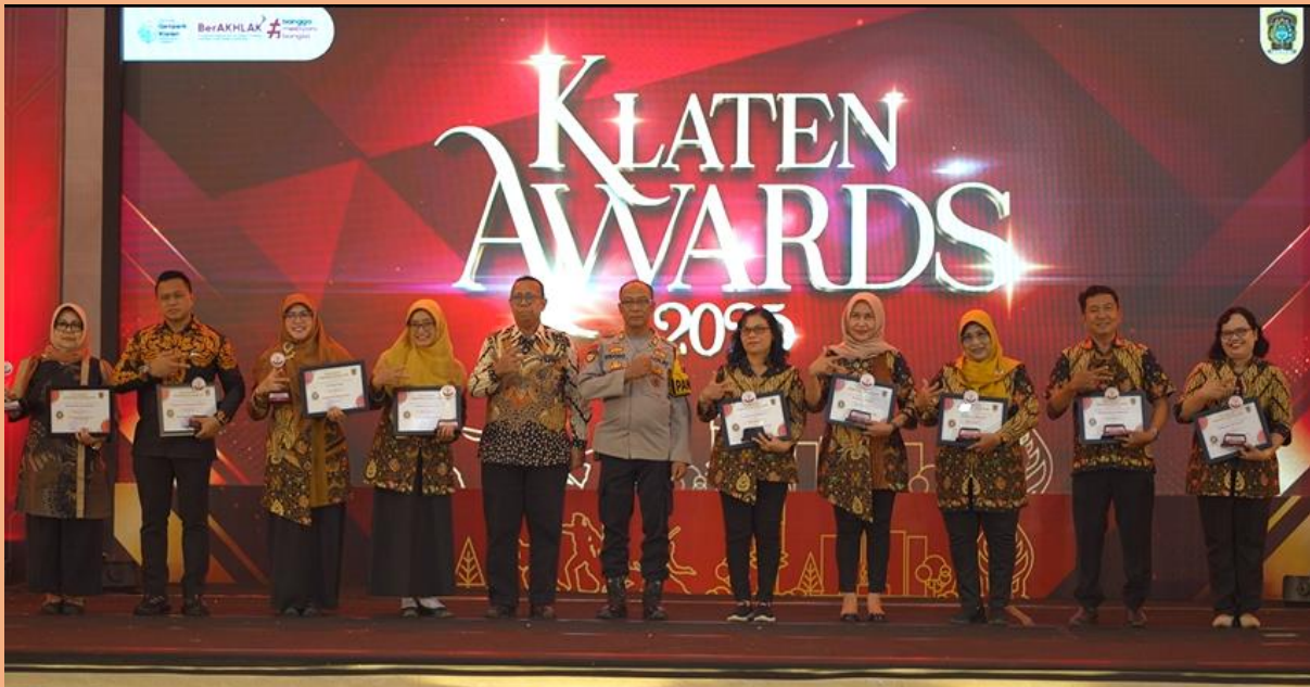
Gambar 9. Penghargaan Pemeringkatan KIP Pemerintah Kabupaten Klaten Tahun 2025