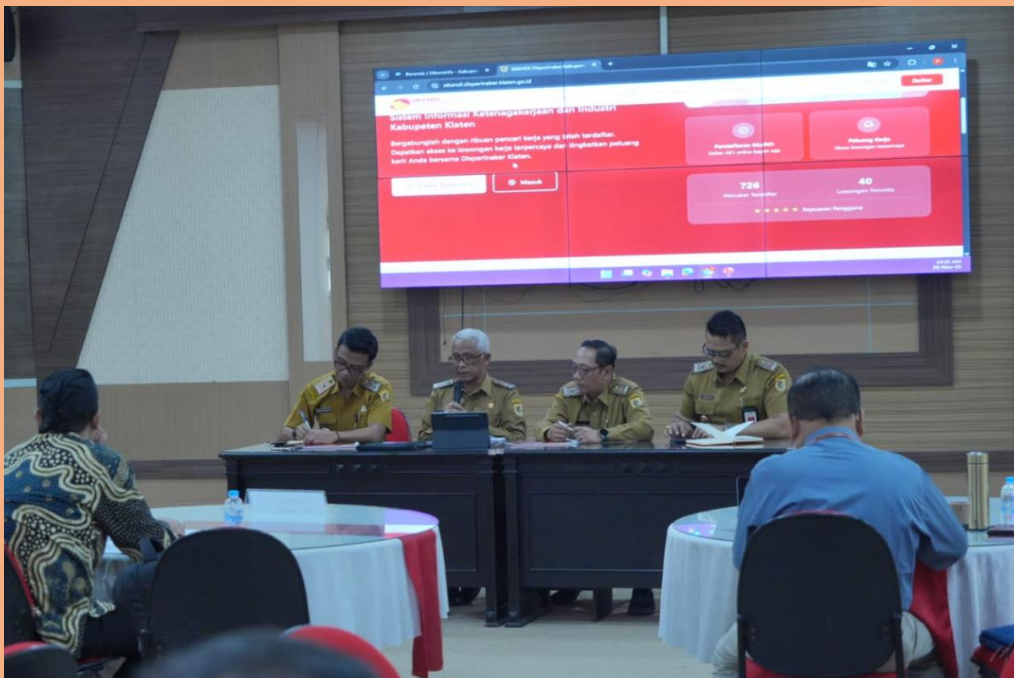
Gambar 8. Uji Publik Pemeringkatan KIP Tahun 2025 Propinsi Jawa Tengah