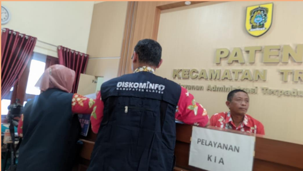
Gambar 5. Visitasi Pemeringkatan KIP Tahun 2025 di Badan Publik Kecamatan