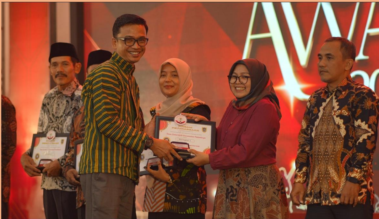
Gambar 10. Penyerahan Penghargaan Pemeringkatan KIP Pemerintah Kabupaten Klaten Tahun 2025