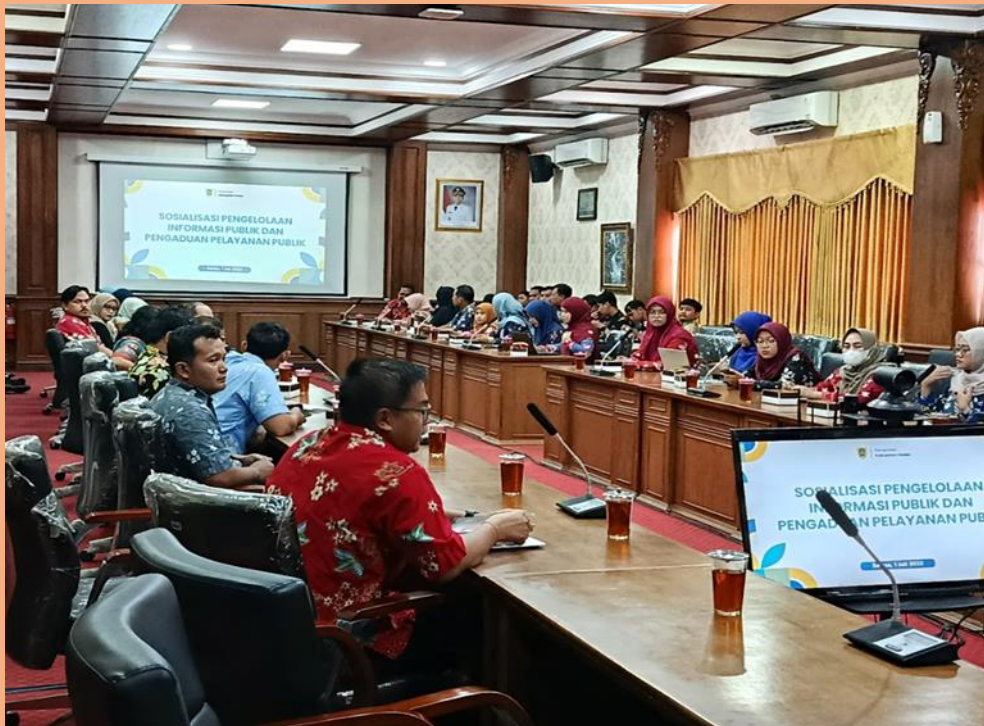
Gambar 3. Sosialisasi Pengelolaan Informasi Publik pada 01 Juli 2025