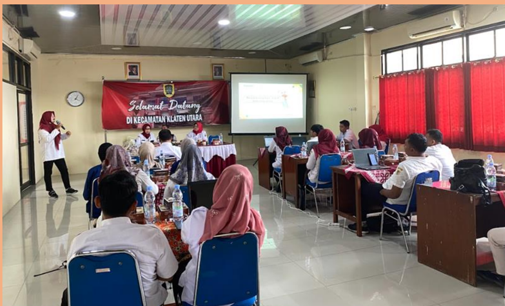
Gambar 4. Sosialisasi Pengelolaan Informasi Publik